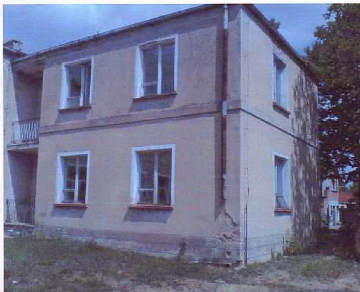
Fot. nr 2. Budynek mieszkalny – były dom nauczyciela z osobnym wejściem