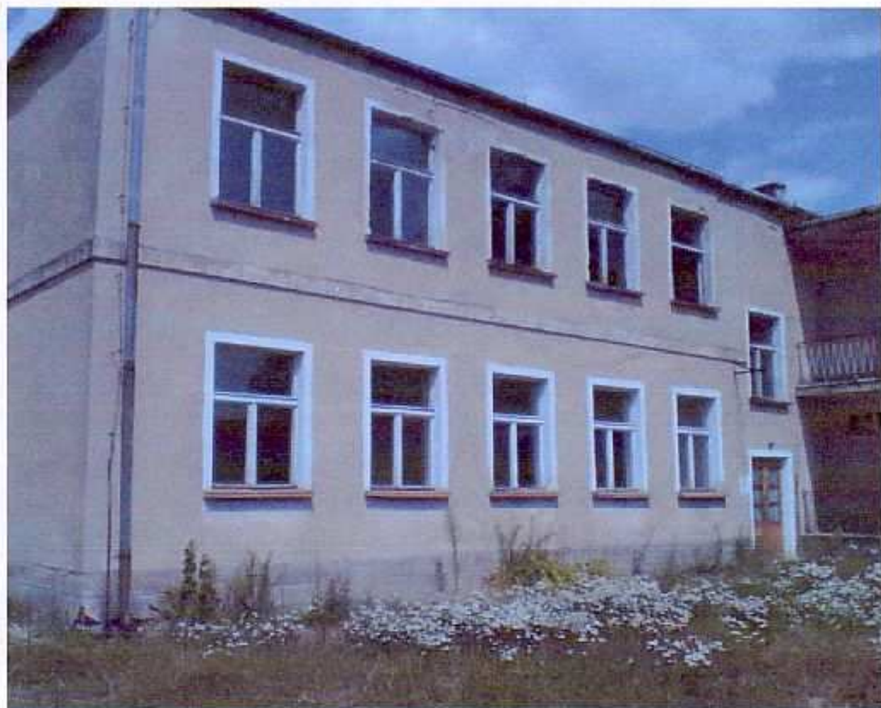
Fot. nr 3. Budynek oświatowy z osobnym wejściem