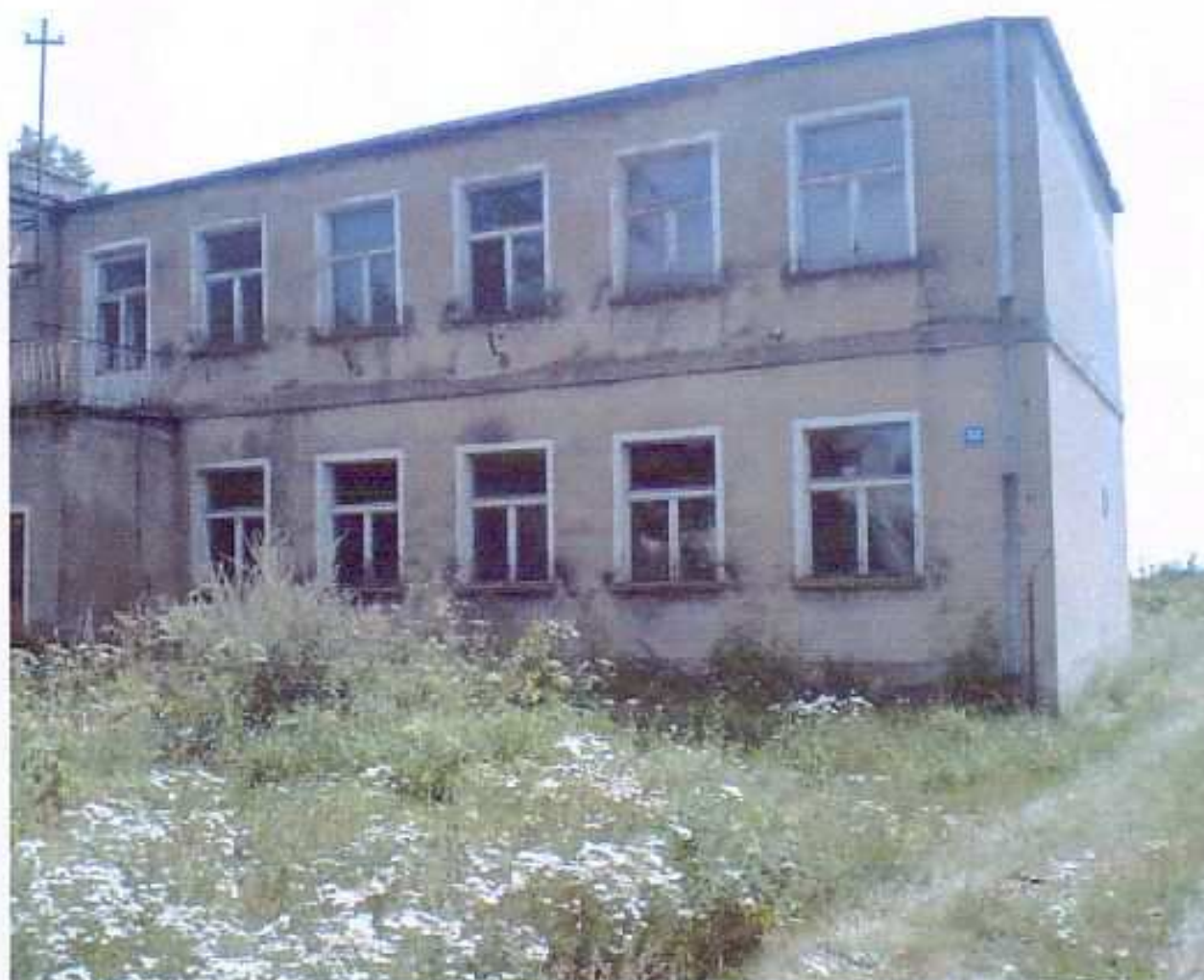
Fot. nr 4. Budynek byłej szkoły podstawowej, elewacja północna