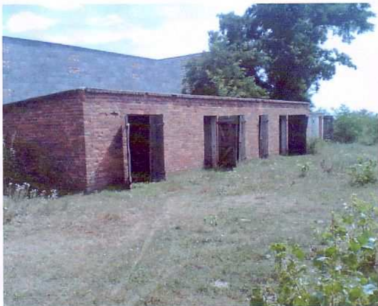
Fot. nr 6. Budynek gospodarczy, komórki składowe