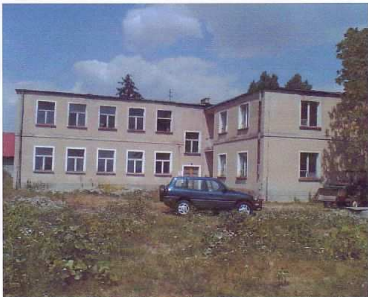
Fot. nr 1. Budynek byłej szkoły podstawowej z częścią mieszkalną, elewacja południowa