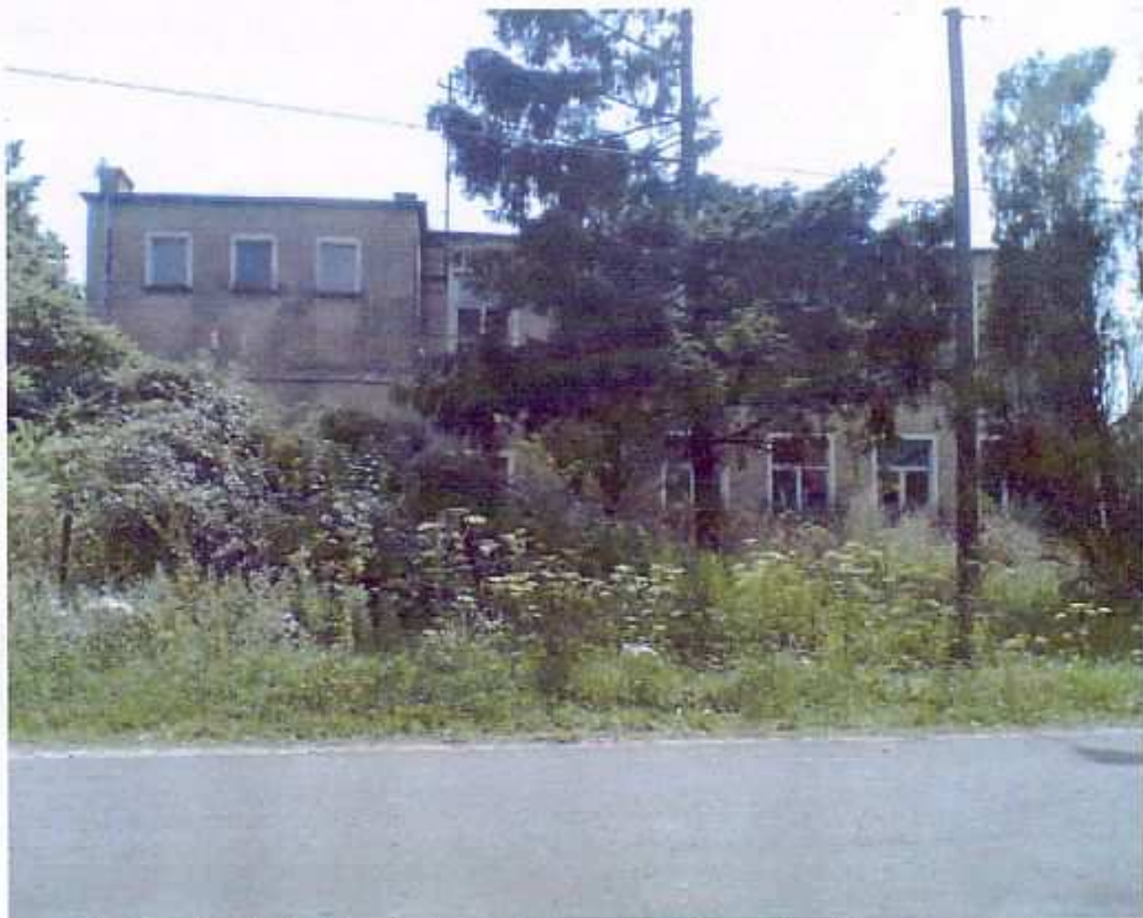
Fot. nr 5. . Budynek byłej szkoły podstawowej, elewacja północna, od strony ulicy